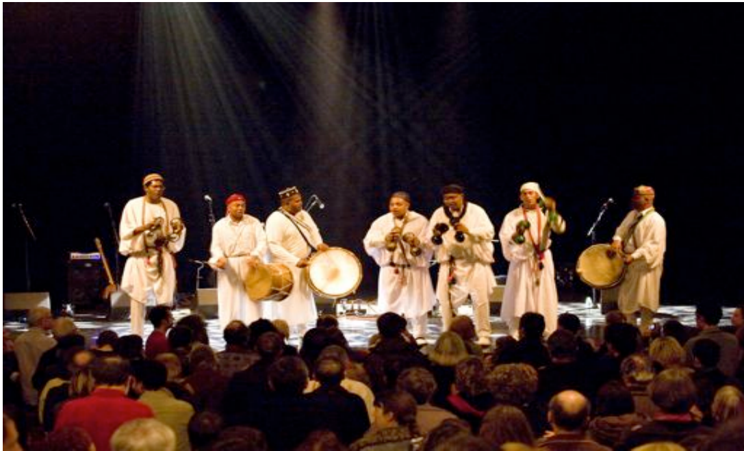
© Les arts improvisés - Arthur Péquin